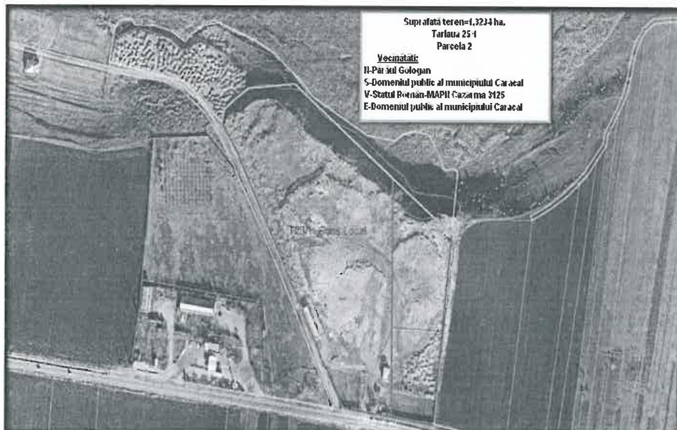
PLAN DE SITUAȚIE