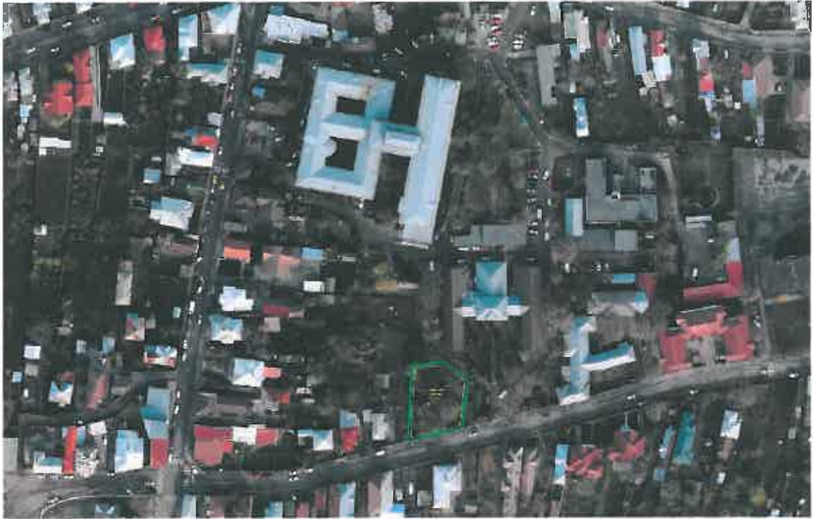
ÎNCADRARE ÎN ZONĂ