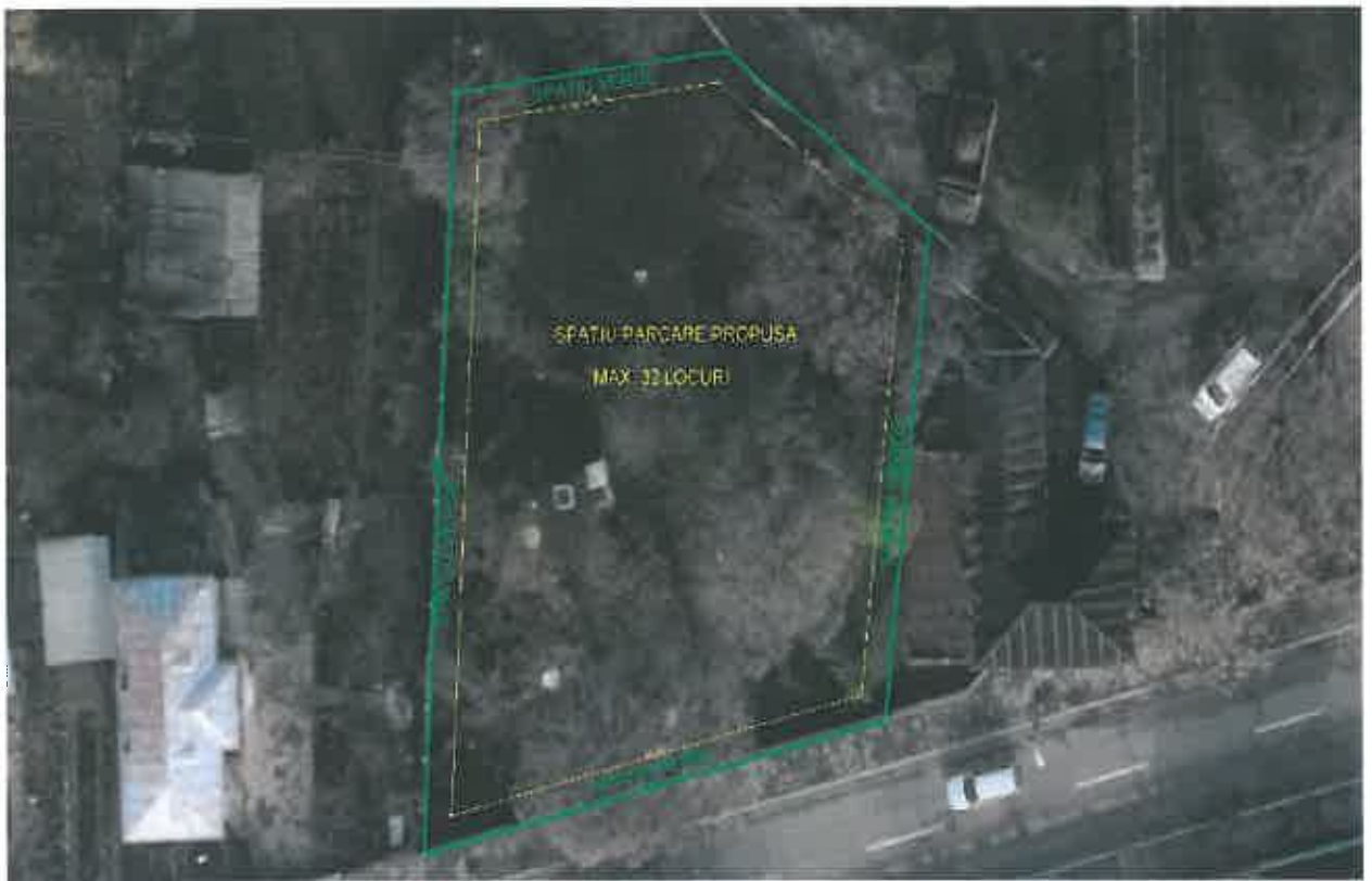
PLAN DE SITUAȚIE