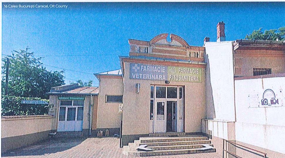
Img. Casa Monument, str. Calea Bucuresti nr. 16

Terenul care a generat Puz se afla in ZONA DE PROTECTIE PENTRU MONUMENTE ISTORICE, deoarece se afla pe aceeasi insula urbanistica (tesut urban delimitat de strazile: Ion Heliade Radulescu, General Gheorghe Margheru, Calea Bucurestu si lantau Jianu) cu o casa declarata monument istoric. Astfel, pe aceeasi insula urbanistica la periferia nordica se afla Casa declarata monument istoric Cod LMI OT-II-m-B-08724, la adresa str. Calea Bucuresti nr.16, casa edificata in 1894. Intre limita de proprietate sudica cea mai apropiata de parcela beneficiarului si limita nordica a acestuia pe cea mai scuta linie este o distanta de 24,00m iar distanta intre extramitetea nordica cea mai apropiata de casa-monument si constructia monument propriu-zisa sunt 46.66,00 m.