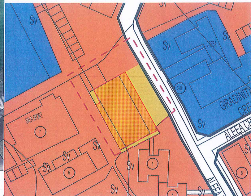
Img. extras PUG Mun Caracal - Reglementari urbanistice - zonificare - incadrare in zona

Terenurile care au generat PUZ pot fi identificate astfel: 1. Teren intravilan, liber de sarcini, curti constructii, nr cf.: 59830, la adresa Aleea Dragoș Vodă nr. 7M - proprietatea Municipiului Caracal, domeniul privat dat in concesiune pentru o perioada de 49 de ani incepand din 2023 catre SC CERES COM SRL;