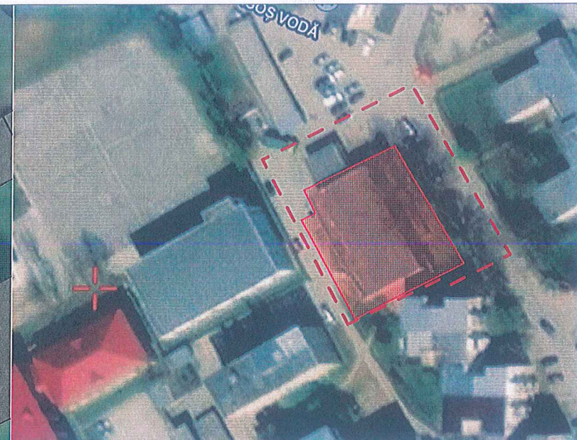
Img. google maps - vedere din satelit - incadrare in zona

LC - locuinte colective medii POT - 30% CUT - 1.5 RH max - P+3-4 (16m la cornise)