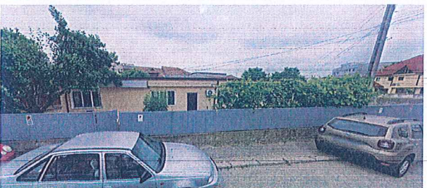
14. SPATII PROFESII LIBERALE SI SERVICII COMERCIALE