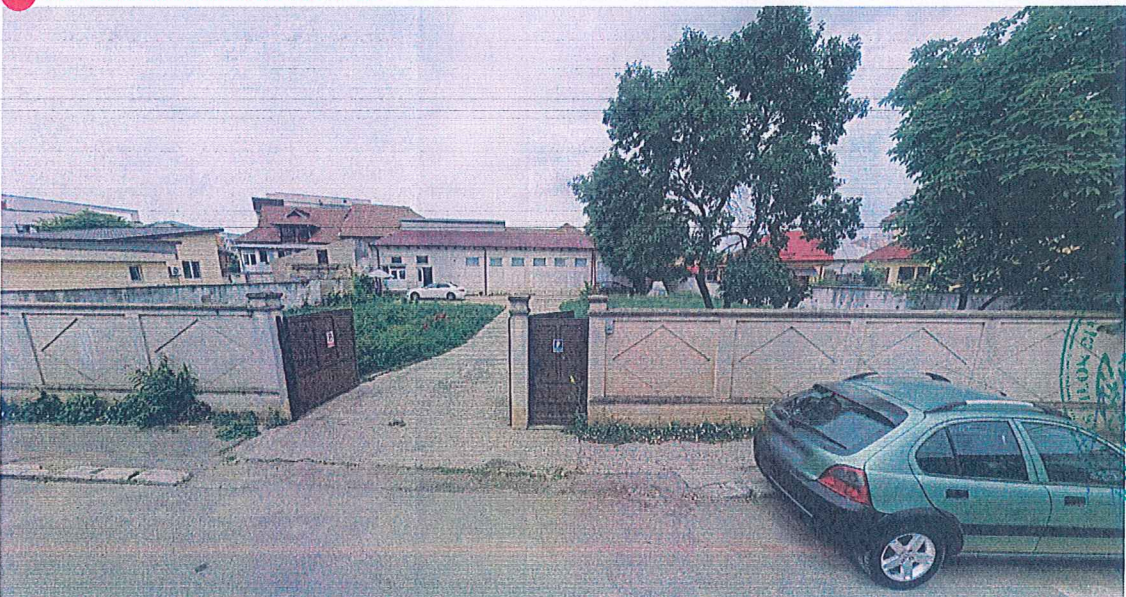
12. CONSTRUCTIA CARE A GENERAT PUZ, CONSTRUCTII EXISTENTE ANEXE