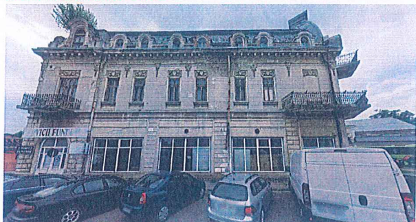
1. SERVICII FUNERARE