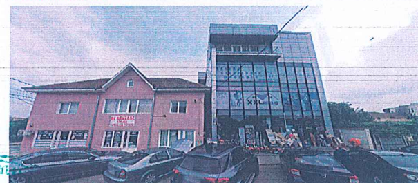
8. CENTRU DE RECUPERARE MEDICALA, MAGAZIN MATERIALE DE CONSTRUCTIE