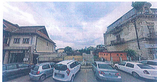
2. SERVICII FUNERARE