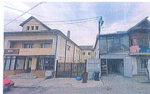
4. SERVICII COMERCIALE SI LOCUINTA