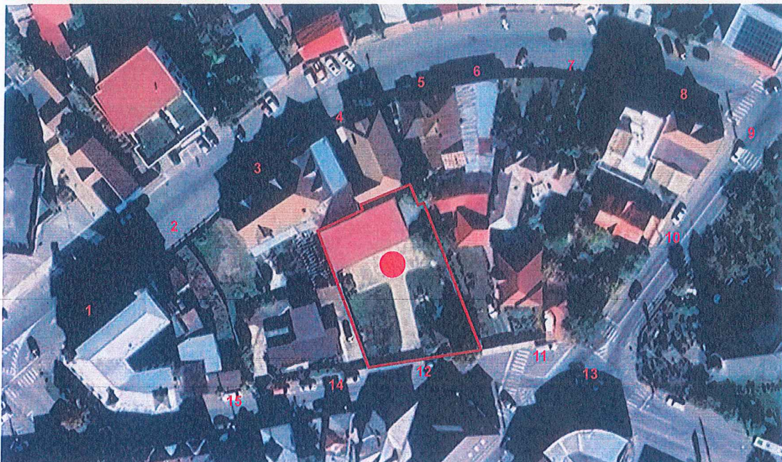
12 TEREN CARE A GENERAT PUZ