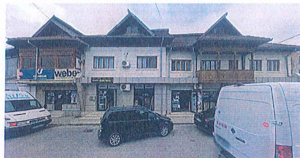
3. SERVICII COMERCIALE SI LOCUINTA