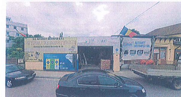
6. MATERIALE DE CONSTRUCTIE