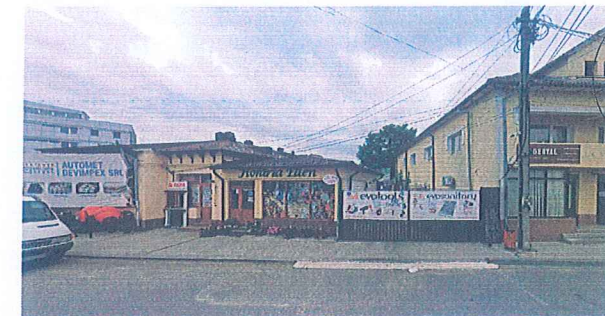
5. SPATIU COMERCIAL FLORARIE EDEN