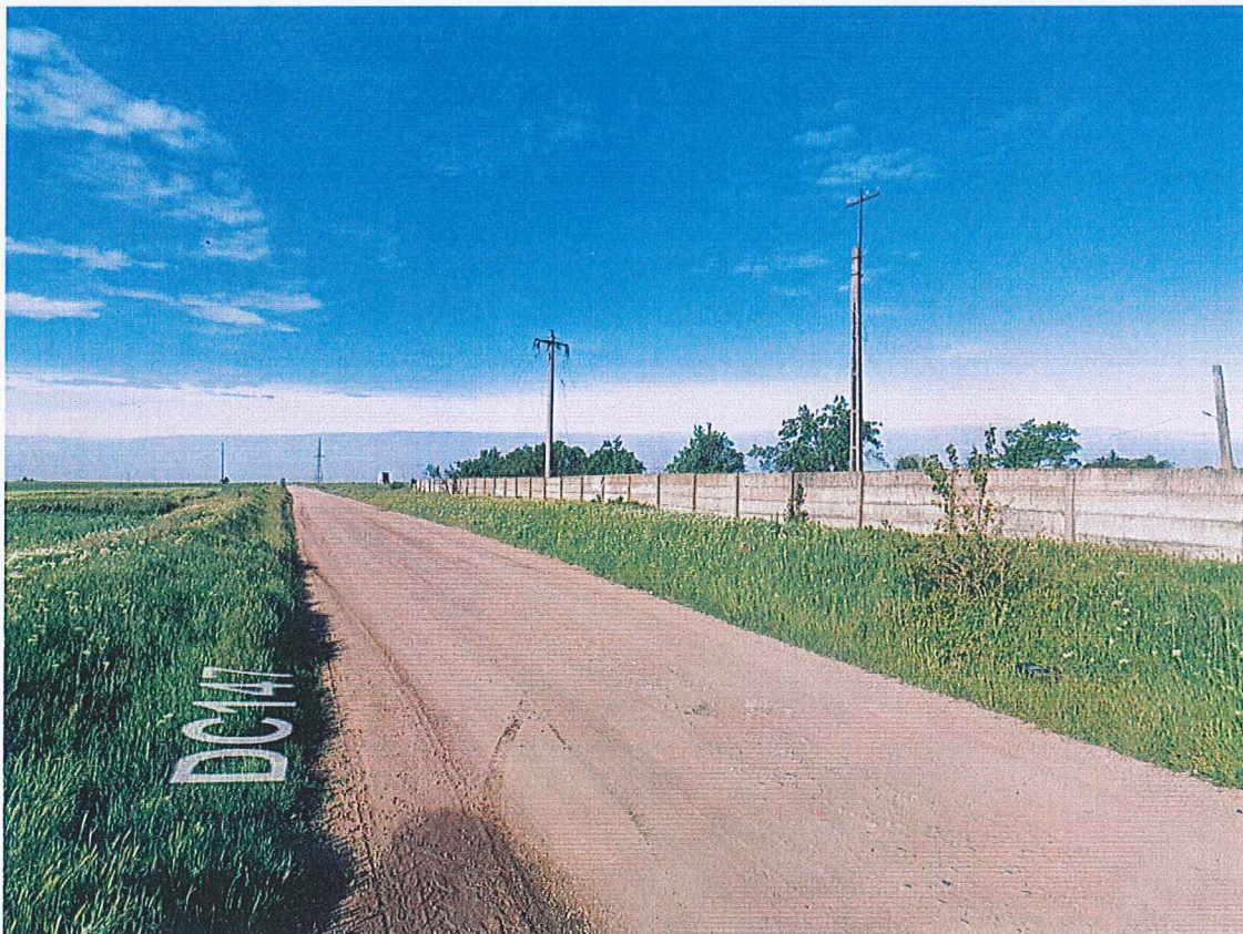
Img. Google earth – situatie existenta perspectiva drum communal DC147.

Drumul comunal DC 147 in zona terenului ce a generat PUZ, are un profil variabil, conform PUG este reglementat de 20.00m si ar trebui sa contina 1 banda pe sens – 3,50m carosabil x 2 = 7m (1 bandă de circulație pe sens), cate 1.5 m spatiu rigola si 4.50 spatiu verde.