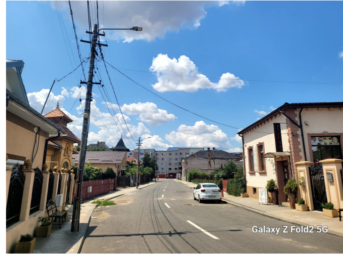
Galaxy Z Fold2 5G