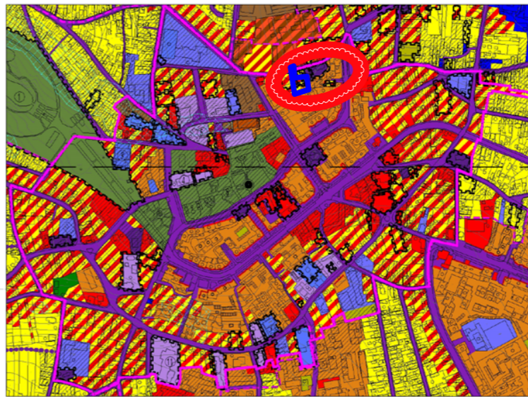
DETALIU ZONA CENTRALA A MUNICIPIULUI CARACAL

Indicii urbanistici existente pentru amplasamentul studiat in s= 1420 mp sunt: Existent • P.O.T. = 35,00% • C.U.T. = 1.15 • REGIMUL DE INALTIME P+1/P+2